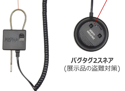
バグタグ2スネア (展示品の盗難対策)