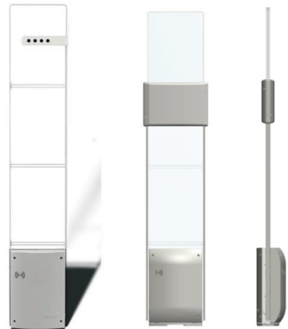
人数カウンター 搭載機種

アンテナ部分には透明なプレキシガラスを使用、デザイン性と高い検知性能を両立しています。また、LEDを内蔵しており、アラーム発報時に点滅するほか、常時点灯することも可能です。