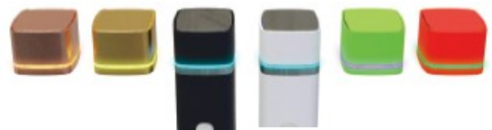
カスタム例（ラッピング／オプション）

* 本パンフレットに記載された社名および商品名などは、それぞれ各社の商標または登録商標です。 * 本パンフレットの記載内容は2023年5月現在のものです。内容および対象商品については、予告なく変更する場合があります。