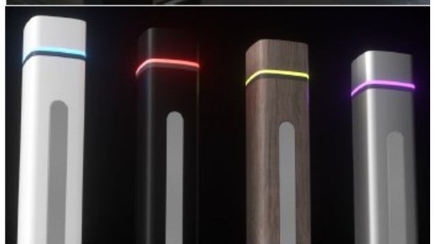
カスタム例（ラッピング／オプション）