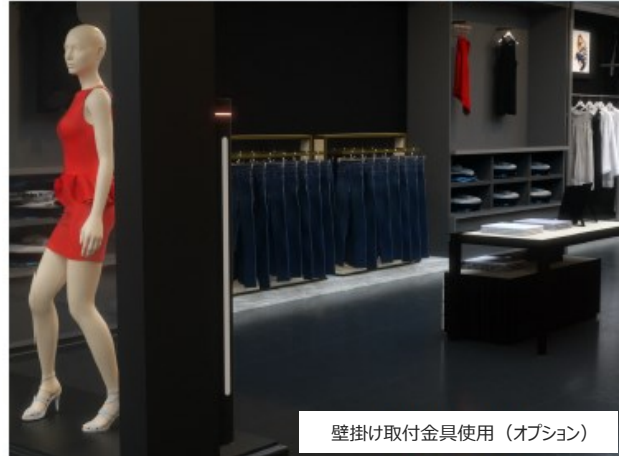
壁掛け取付金具使用（オプション）