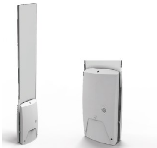
ベースカバー内に RFID基板を格納

チェックポイント独自の技術「Wirama Radar」を採用。盗難の可能性がある商品をより正確に特定し、精度の高いロス対策を実施できます。