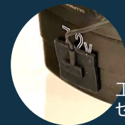
工具のバッテリー部分に センサーパッドを貼付