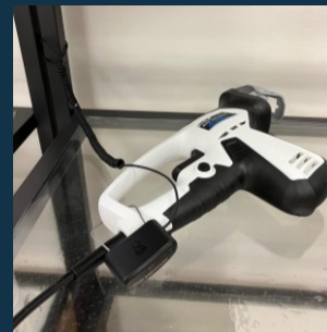
取付例 (センサーパッドなし)