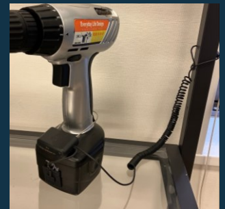
取付例 (センサーパッド付)